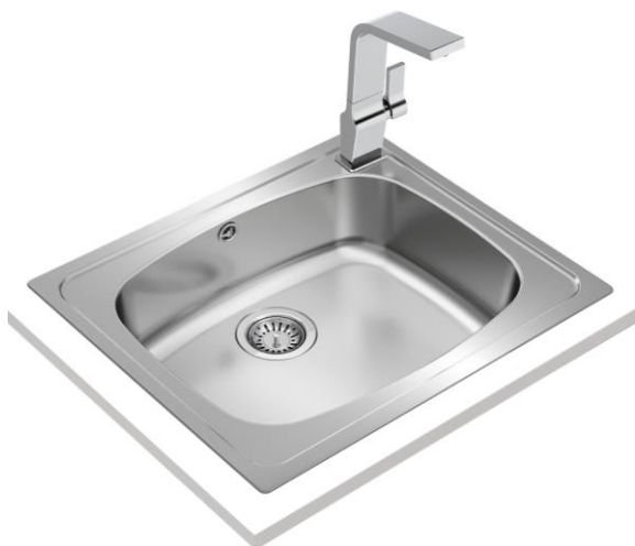
UNIVERSE Personalidad única