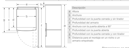
Dimensiones en mm