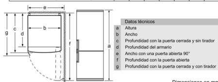
Dimensiones en mm